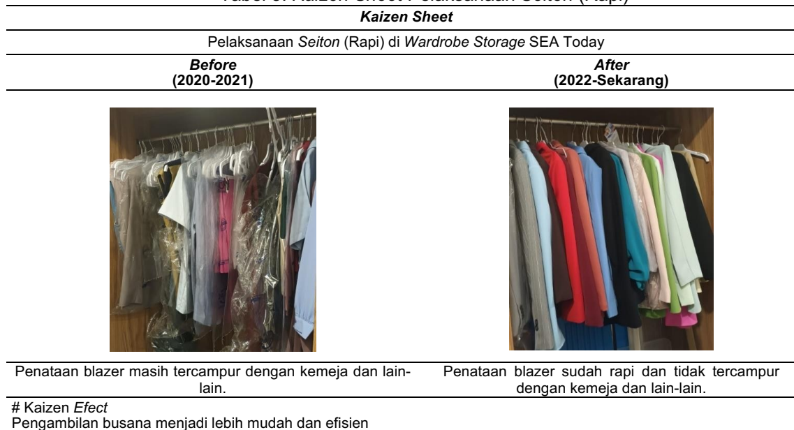
Tabel 3. Kaizen Sheet Pelaksanaan Seiton (Rapi)

Penerapan kaizen di wardrobe storage sudah sangat baik, meskipun sebagian besar kegiatan yang dilakukan secara manual dan hanya dalam pencatatan data dilakukan dengan menggunakan komputer, pemasangan addressing busana, serta penyortiran busana dari laundry juga masih dilakukan secara manual dengan memilah busana berdasarkan jenis terlebih dahulu, kemudian dipasangkan addressing kegiatan ini membutuhkan banyak waktu dalam melakukan satu pekerjaan. Adapun hasil dari observasi mengenai penerapan kaizen di wardrobe storage SEA Today, maka diperoleh contoh foto dokumentasi before after pelaksanaan kaizen 5S di wardrobe storage dalam bentuk kaizen sheet sebagai berikut: